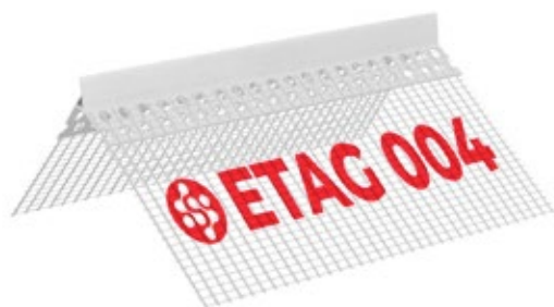
PPLAGOC-04 Paraspigolo con gocciolatoio doppio nascosto