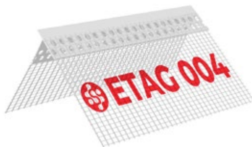
PPLAGOC-05 Paraspigolo con gocciolatoio nascosto